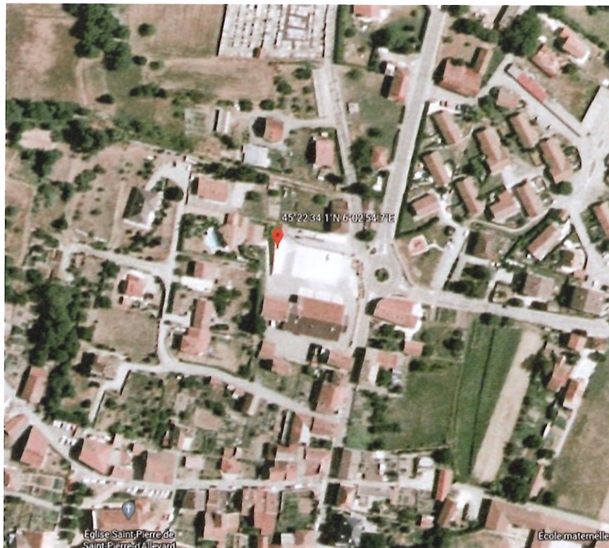
Annexe 2 - Descriptif de l'infrastructure de recharge VE