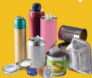
EMBALLAGES MÉTALLIQUES, MÊME LES PLUS PETITS