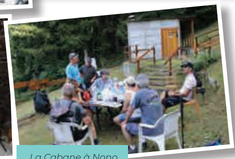
La Cabane à Nono