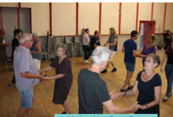
initiation West Coast Swing