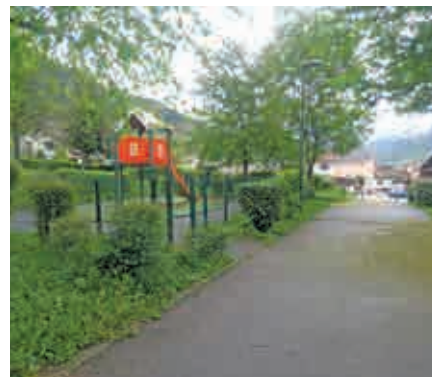
Emprise de l'aire de jeux sur laquelle va se développer l'extension du parking

pour enfants qui n'est plus aux normes (et qui sera réaménagée à proximité). Les nouvelles places de parking favoriseront l'infiltration des eaux pluviales, et sont intégrées d'un point de vue paysager en cohérence avec la proximité du parc.