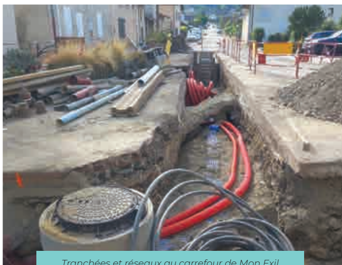
Tranchées et réseaux au carrefour de Mon Exil (vue en direction de l'avenue d'Uriage)

Les élus et services de la commune tiennent à vous remercier pour votre bienveillance, votre patience et votre adaptation à ces contraintes.