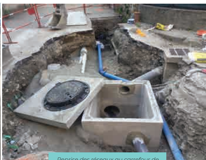
Reprise des réseaux au carrefour de la rue de la Charrière