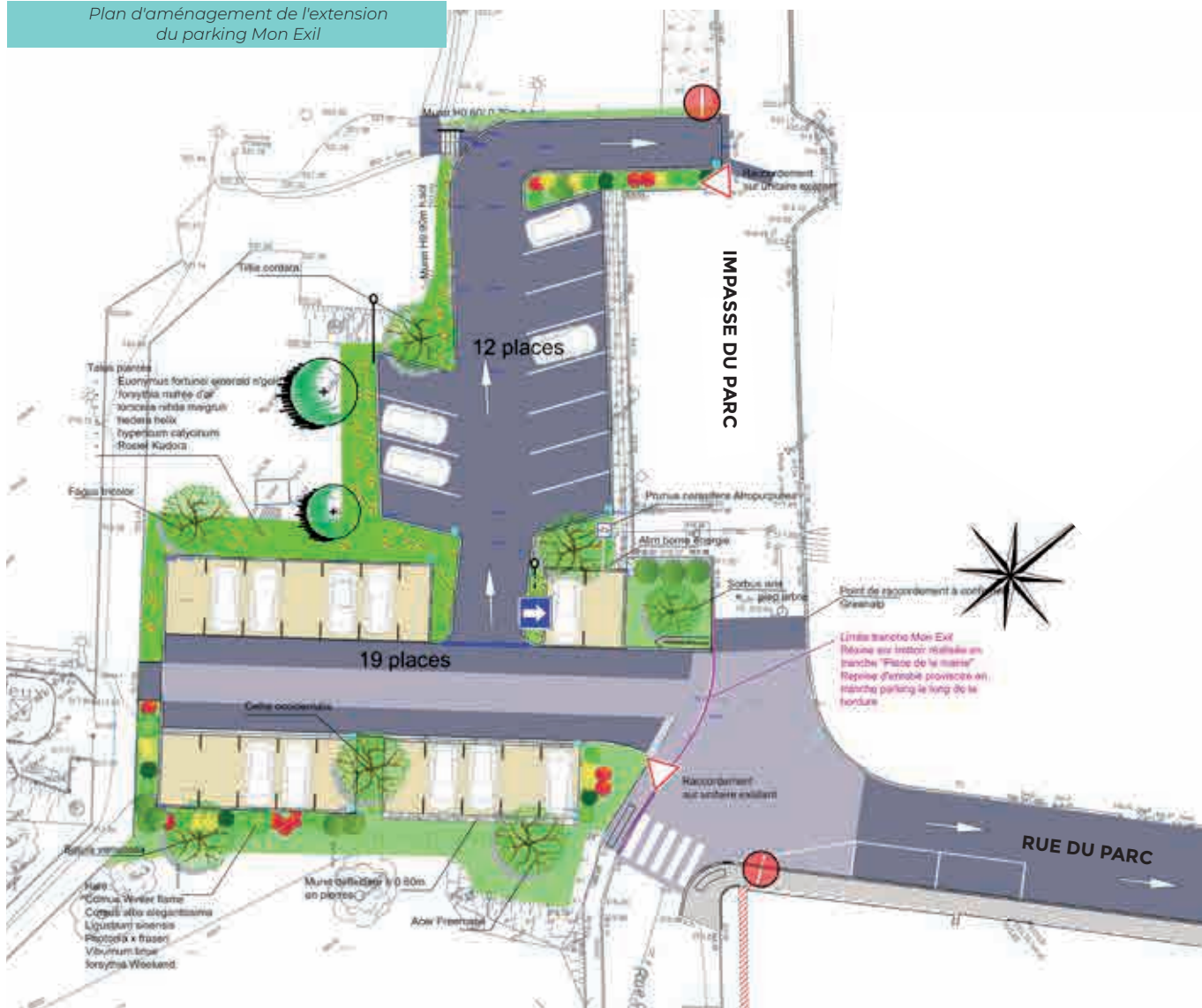
Plan d'aménagement de l'extension du parking Mon Exil