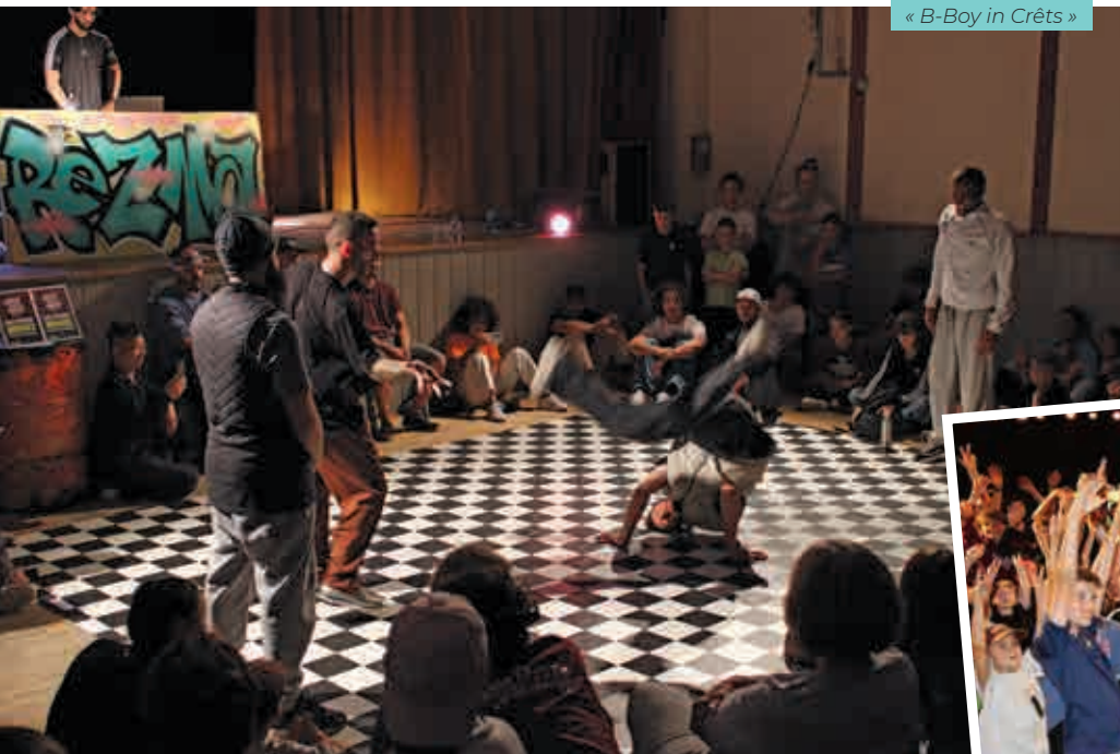
« B-Boy in Crêts »

L'après-midi a eu lieu la 3ème édition de « B-Boy in Crêts », battle de danse hip hop organisé par l'association « 38ème parallèle ».